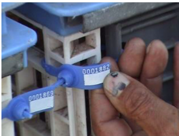
6. Detalle de precintos