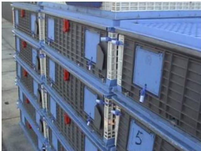
4. Revisión del estado de precintos