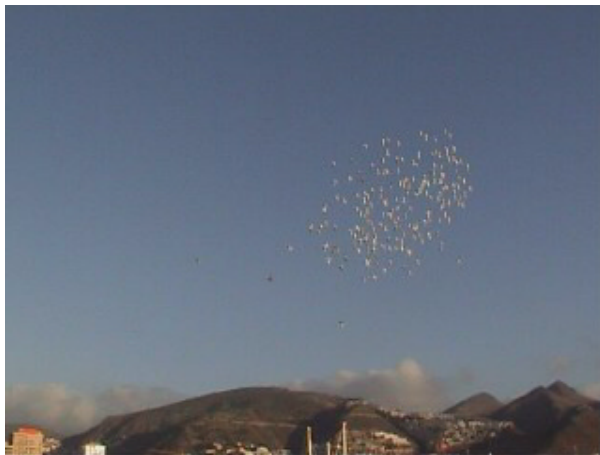
11. Tres palomas se separan del bando y regresan al punto de suelta