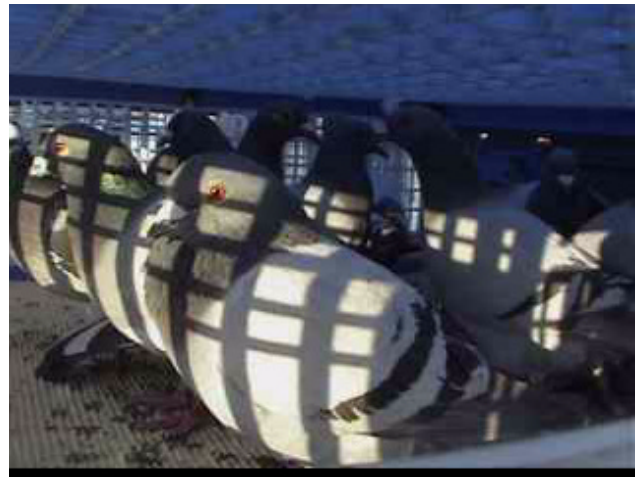
3. Diez palomas por cesta