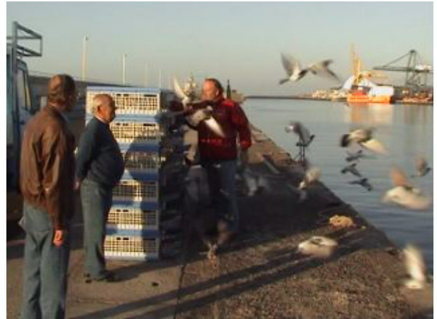
8. Suelta a las 8:00 horas