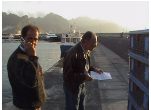
1. Comunicación con el Director del Derby para la comprobación de las condiciones meteorológicas en el punto de suelta (Viento muy flojo del Norte)