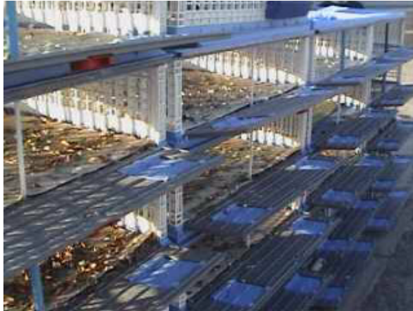
9. Comprobación de que no han quedado palomas en las cestas