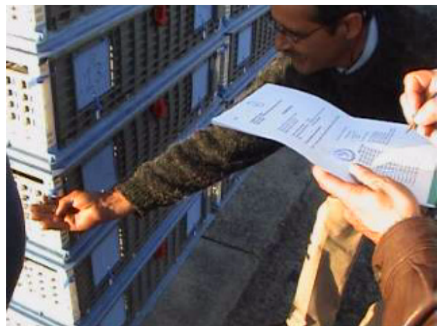
5. Comprobación de la numeración de cada precinto en el Acta de Suelta